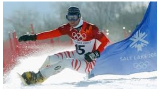
Markus Ebner – Snowboarder 1999 Weltmeister 2001 WM Silber 2003 Platz 3. Gesamtweltcup