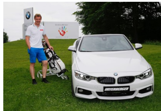
Felix Loch - Rennrodler