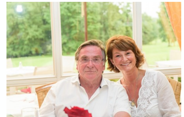
Elmar Wepper - Schauspieler Polizeiinspektion 1 Traumschiff Tatort: Tod auf der Walz Der Millionenbauer