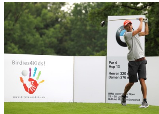
Björn Kircheisen – Nordische Kombination 3x Olympia Silber 8x WM Silber 6x Juniorenweltmeister