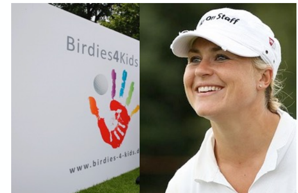
Martina Eberl - LET Profigolferin 2008 Platz 1. BMW Ladies Italian Open 2008 Platz 1. Nykredit Masters 2007 Platz 1. Madrid Ladies Masters