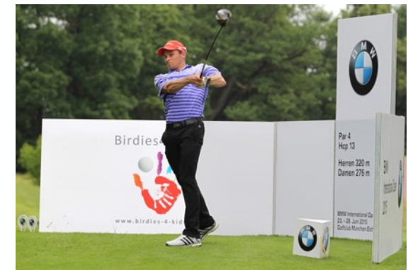
Tobias Angerer - Skilanglauf