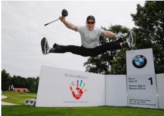
Dieter Thoma - Skispringer