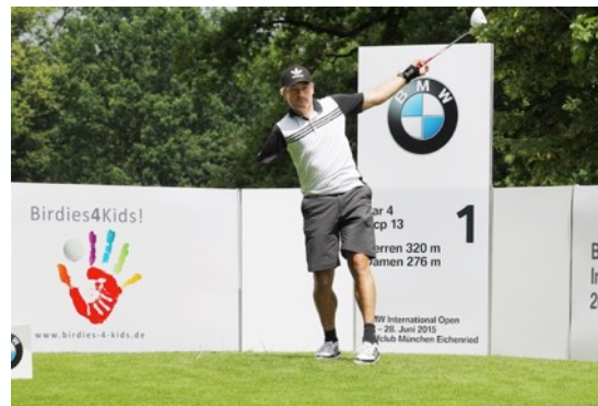
Gerd Schönfelder - Skirennfahrer