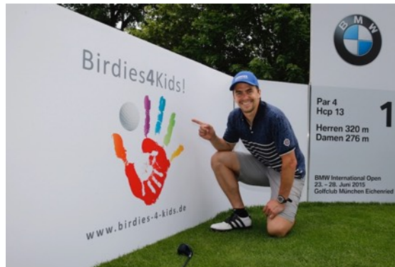
Michael Greis - Biathlon